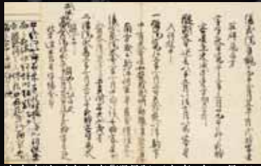
冷泉家時雨亭文庫「明月記／寛喜2年11月8日／藤原定家自筆」(国宝)