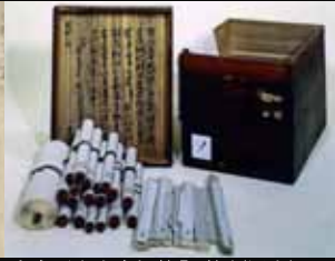
東寺百合文書桐箱「ノ箱」(国宝)