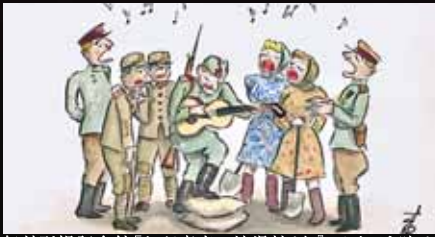
舞鶴引揚記念館「わが青春の浪漫抄より「こんなひと時は捕虜である自分を忘れる」」