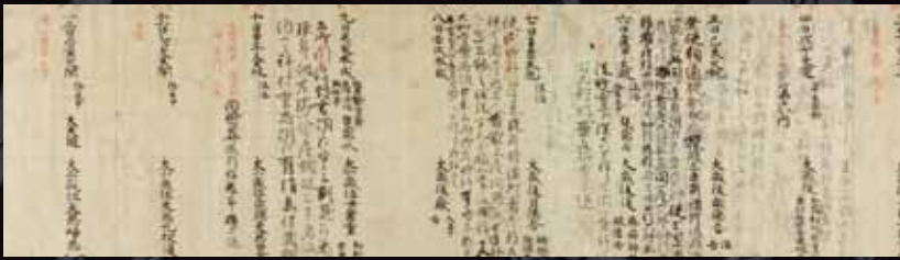
陽明文庫「御堂関白記／寛弘元年2月6日」(ユネスコ記憶遺産登録／国宝)