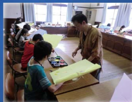
絵付け体験の様子