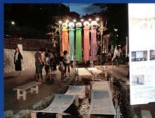
過去の作品展示の様子

◎ 展示期間中の万一の破損・盗難など不慮の事故等により生じた作品の損害については責任を負いかねます